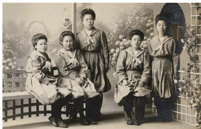
セーラー型体操服を着用した生徒たち